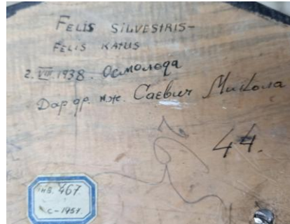
Рис. 2. Кіт лісовий ( Felis silvestris ) дарований музею НТШ М. Саєвичем.