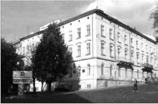
Рис. 1. Будинок Наукового товариства на вул. Винниченка.