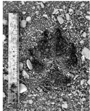
Рис. 2. Арктичні моменти: (а) після відстрілу полярних вовків з гелікоптера (за розпорядженням «Главохота РСФСР») в заповіднику о. Врангеля в квітні 1981 року; (b) слід полярного вовка на о. Геральд, коса Сенді, кінець 1980-х.