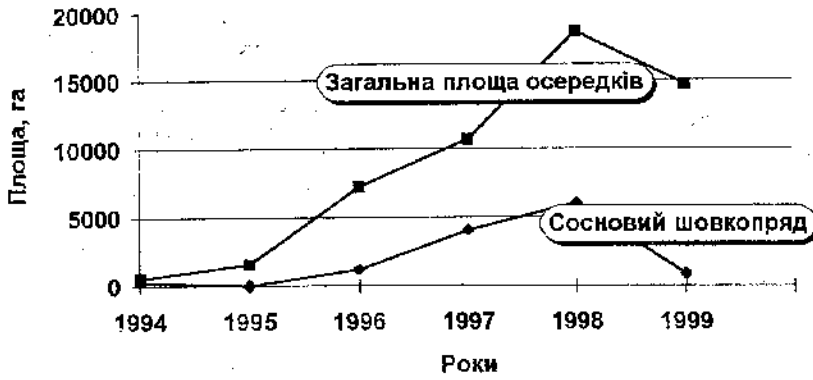
Рис. 3. Площа осередків розвитку основних шкідників і хвороб лісових насаджень

но-географічних умов сприяє тривалому існуванню природних осередків інфекцій. Чисельність випадків захворювання ПОІ у людей і свійських тварин неухильно зростає. Недостатнє вивчення територій щодо наявності збудників ПОІ, їх носіїв та господарів, незадовільний стан досліджень у відомих діючих осередках, практично повна згорнутість досліджень із виявлення нових неблагополучних територій - все це становить реальну загрозу не тільки населенню окремих регіонів України, а й для національної безпеки взагалі.