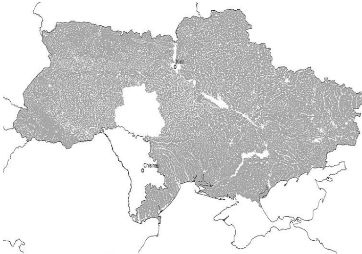
Рис. 3. Ареал вовка в межах України за результатами моделювання в EEVIO (GLOBIO). Проекція GCS Pulkovo 1942.

Так чи інакше, досвід EEVIO (GLOBIO) показав, що повернення у минуле, спрощений підхід до відображення ареалів без будь-яких технічних пояснень і аргументів (для території України, площа якої 603,7 тис. км 2 ), свідчатиме про низький рівень виробників картографічної інформації. Із цим мусить рахуватись і Мінприроди України, і грантодавці. У масштабах України централізована ГІС, принаймні щодо ссавців, умовно, мала би забезпечувати безперебійну роботу із цифровим пакетом у два рази більшим, ніж той, що пройшов тестування за ініціативи і підтримки EEVIO. Очікуваний обсяг станом на 2010 — це не менше ніж 4,5 Gb. Жодна із приватних чи державних установ про такі наміри іще не заявляла.