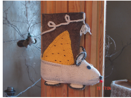
Рис. 3. Експонат з Музею Валянок.

Найнасиченішою виявилася секція «Філогеографія, філогенетика і систематика (близько 50 доповідей). Багато з цих доповідей було присвячено використанню генетичного методу досліджень для вирішення питань географічного розповсюдження підвидів, гібридних зон, в першу чергу у Mus m. musculus та M. m. domesticus , у роді Microtus . Велику частину доповідей на цій секції склали виступи польських, турецьких і російських колег.