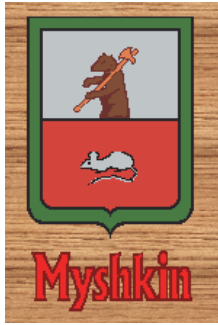
Рис. 1. Герб м. Мишкін.