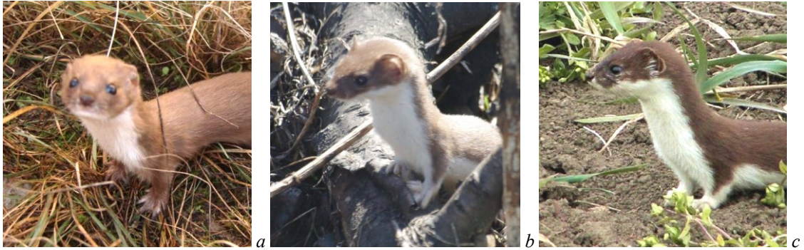
Рис. 1. Деталі «літнього» забарвлення ласок (верхня губа, передні лапки, межа білого і бурого кольорів на боках) з різних місцезнаходжень в Україні: a — Асканія-Нова (, 15.01.2009), b — Донецька (, 3.04.2009), c — Тростянець (, 25.04.2007).