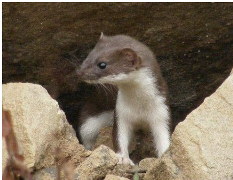
Рис. 4. Ласка в літньому вбранні зі сходу України, з околиць м. Лисичанськ: загалом такий тип забарвлення відповідає формі « nivalis » — лапки білі (зимове забарвлення у тому регіоні напевно біле), проте верхня губа без білого забарвлення.

Fig. 3. A detailed map of distribution of different color phases of the weasel ( Mustela nivalis ) based on a database, which includes the results of questionnaires and interviews with colleagues, as well as the analysis of photos of the weasel obtained from colleagues. Dotted lines are boundaries of taxonomic and colored forms. Legend: group « nivalis »: white circles with white stars inside — white fur in winter and white legs and lips in summer, dark stars inside — brown legs and lips in summer; form « vulgaris »: dark circles — brown fur in winter, the legs and lips are brown in the summer phase.