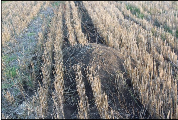
Рис. 2. Курганчик на стерні після колоскових зернових.