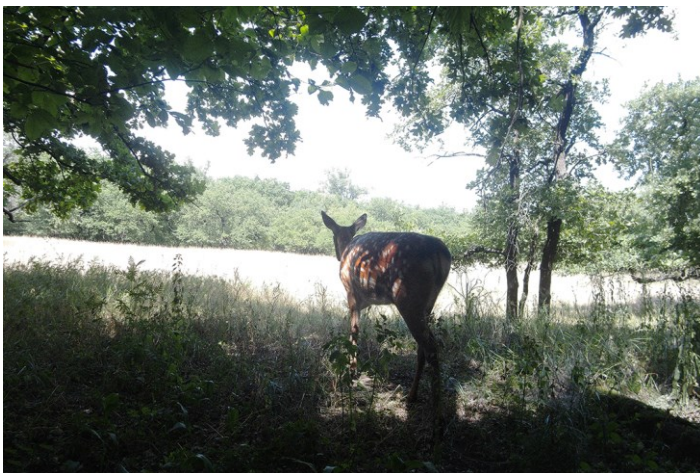
Рис 3. Олень японський на території заповідника Фотографія зроблена фотопасткою в 2022 році.

Олень японський Cervus nippon (Temminck, 1838) — ссавець родини Оленевих, представник лісового екологічного комплексу. Олень японський завезений в Дніпропетровську область у 1961 році [Bulakhov & Pakhomov 2006]. Територія заповідника — одне з місць інтродукції цього виду (рис. 3). Формування популяції до заповідання цієї території відбувалось під пресом нерегламентованого мисливства і браконьєрства, зокрема петельного.