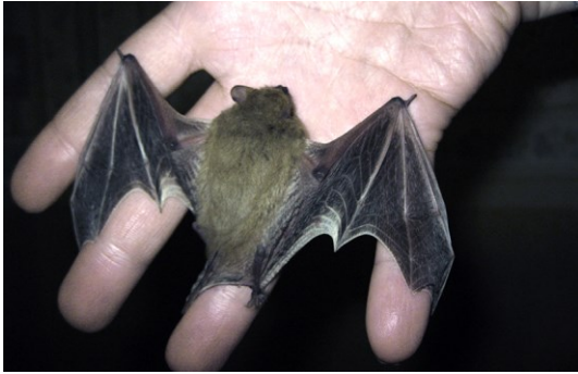
Рис 4. Нетопир білосмугий зареєстрований на території заповідника Дмитром Ганжою у 2017 році.

Fig. 4. Blyth's pipistrelle was recorded in the territory of the reserve by Dmytro Ganzha in 2017.