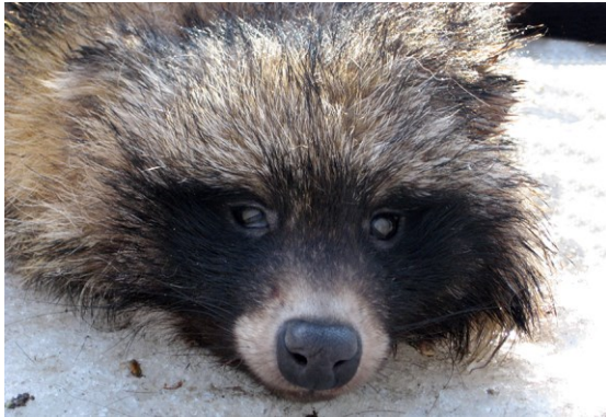
Рис 2. Єнот уссурійський, зареєстрований в заповіднику в 2019 р. Іриною Акуловою.

Відбитки лап уссурійського єнота доволі легко відрізнити від відбитків інших звірів родини псові, вони округлі, довжиною 4,5–5,5 см. Коли тварина ступає, вона розчепірює пальці. Відбитки пальців виразні, овальні, кігті короткі.