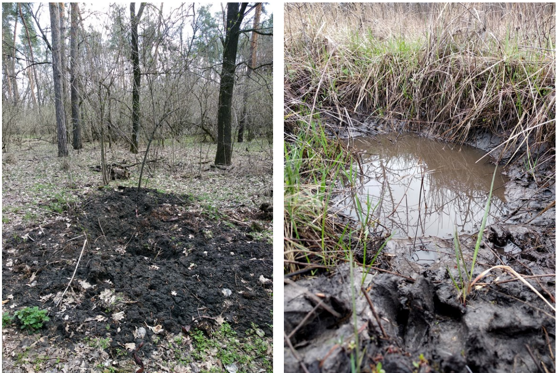
Рис. 5. Сліди перебування кабанів як приклад їхньої середовищевтвірної діяльності: пориї ( a ) та купалка ( b ).

Чисельність свині визначається по показниках їх слідової активності під час зимового маршрутного обліку.