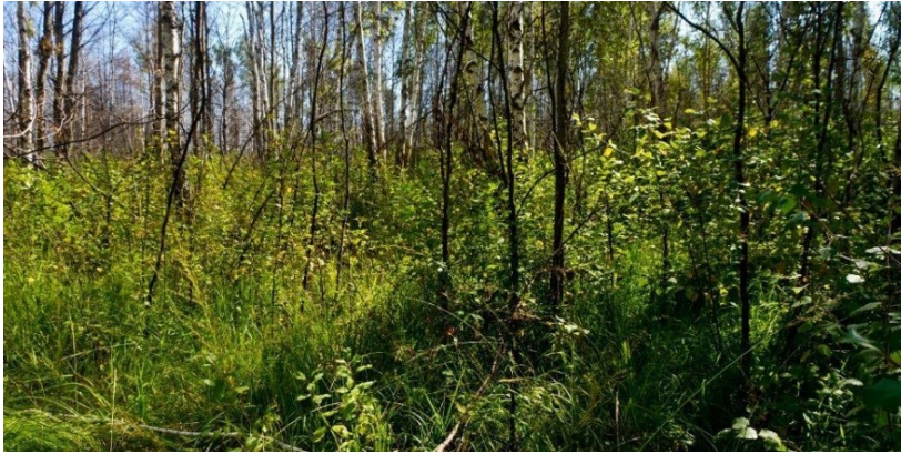
Рис. 4. Полігон 2, вересень 2021 р.