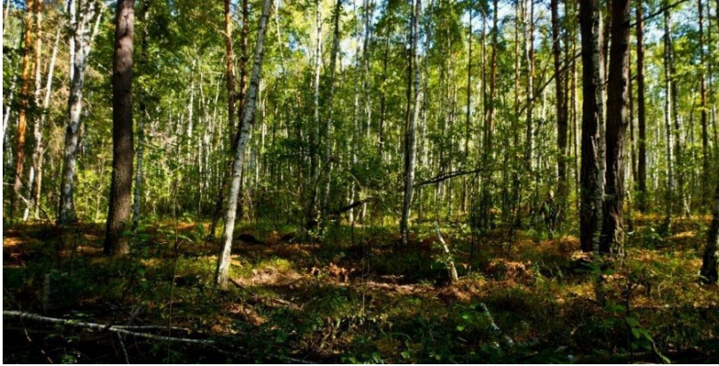
Рис. 3. Полігон 1, вересень 2021 р.