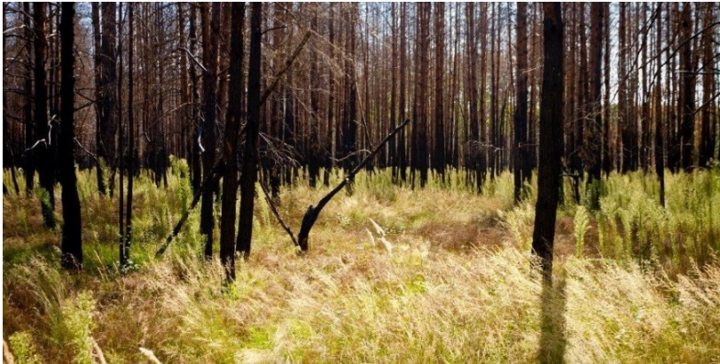
Рис. 5. Полігон 3, вересень 2021 р.