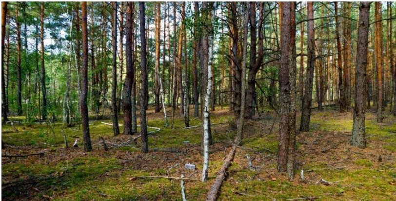
Рис. 6. Полігон 4, вересень 2021 р.