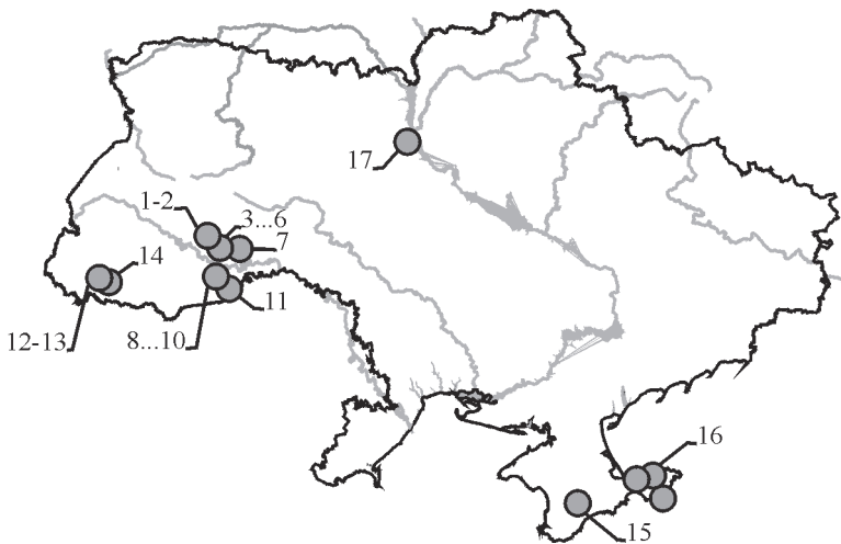
Рис. 2-2. Географічне положення найважливіших підземних місцезнаходжень кажанів в Україні. Цифри — номери печер згідно із табл. 2-1. [Geographical position of the most important underground roosts of bats in Ukraine. Details see in the Table 2-1].