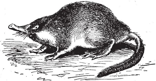
Fig. 6. Russian Desman (drawing by G. Glikman).