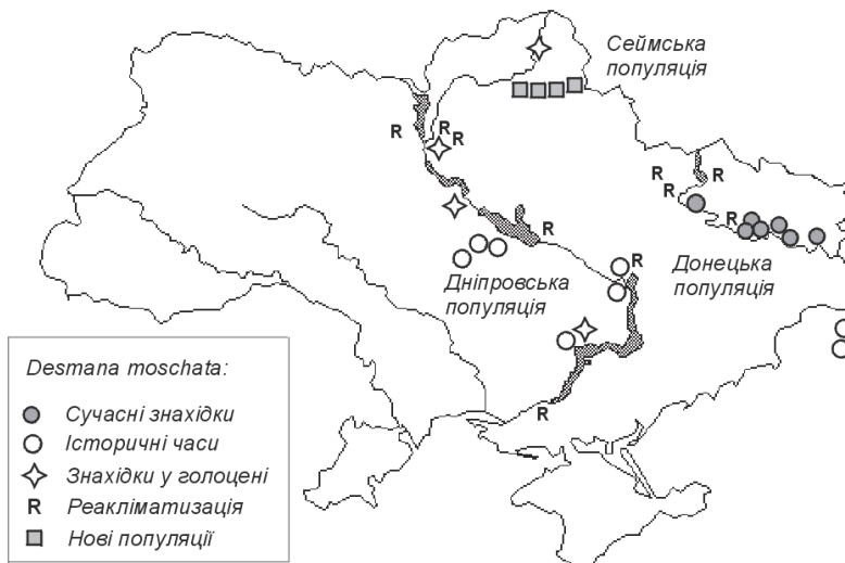
Рис. 1. Ареал хохулі в Україні та його диференціація на три географічні сектори: 1) Дніпровський, 2) Сеймський, 3) Донецький. Знахідки різного часу позначено різними знаками (за: Абеленцев, Підоплічко, 1956, з доповненнями). Fig. 1. Range of Desmana in Ukraine and its differentiation into 3 geographical units: 1) Dniipro, 2) Sejm, and 3) Donets sector. Records of different time are marked by different signs and given after Abelentsev & Pidoplichko (1951), with additions.

Заплава Дінця як історичний ареал виду. Протягом 19-го і початку 20 ст. зоологи відмічали хохулю по всій заплаві Дінця та в деяких місцях середнього і нижнього Дніпра (для огляду див.: Мигулін 1938; Абеленцев, Підоплічко, 1956; Сокур, 1961). Сіверсько-Донецька популяція хохулі докладно описана в багатьох наукових публікаціях, з яких провідне місце займає праця М. Селезньова (1936) про стан популяцій виду на Дінці та О. Мигуліна (1938) про морфобіологічні особливості виду. За даними, що наводять О. Мигулін та М. Селезньов (цит.), на початку ХХ ст. хохуля була звичайним мешканцем заплави Дінця. Власне, тільки звідси відомі достовірні знахідки виду в Україні, підтверджені описами і колекційними зразками (є у всіх головних музеях України).