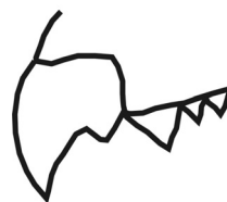
Рис. 1. Форма зубов верхней челюсти

Череп : метрические особенности черепа представлены в таблице 1.