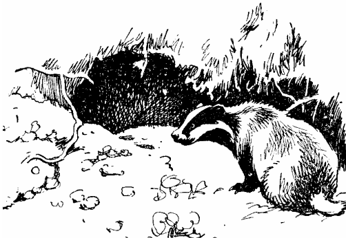
Борсук — типовий троглофіл. Рисунок за: О. Корнєєвим (1967).

Найбільш чисельні знахідки викопних решток стосуються 10 видів хижих ссавців: S. spelaeus (п. Прийма: n=22; Білих Стін: 18; Буковинка: n=?), U. arctos (Прийма: 13), L. lutra (Прийма: 14), M. erminea (Кришталева: 11; Прийма: 1), M. nivalis (Кришталева: 10, Кармалюка: 2), C. spelaea (Прийма: 8;