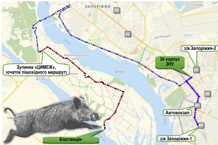
Схема проїзду до ЗНУ та біостанції-профілакторію